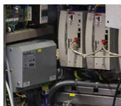
Regulace, měniče/ servosilovače a síťové zdroje