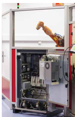
Testovací zařízení pro robotiku

BVS nabízí rozsáhlé servisní služby pro robotické systémy značek ABB, KUKA a FANUC.